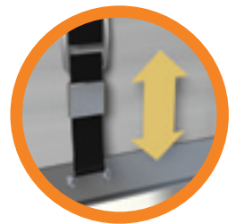
Sujetador con cinturón y gancho